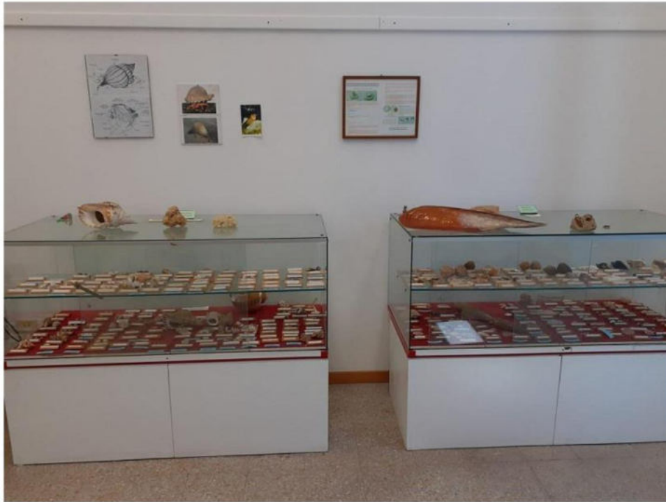
Molluschi, Gasteropodi e Bivalvi