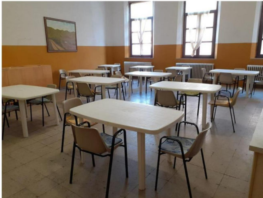
Figura 2: veduta parziale della sala mensa.