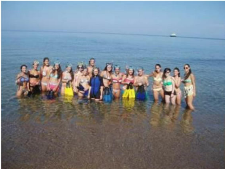
Figura 7: alcuni studenti pronti per lo snorkeling a Baratti.

Per stage di più giorni (almeno una settimana) che interessano le scuole secondarie di II grado possono svolgersi uscite tra cui: