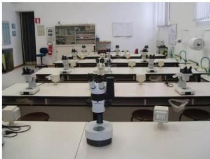
Figura 5: laboratorio didattico con 14 stereomicroscopi e fotocamera applicata ad uno di essi.