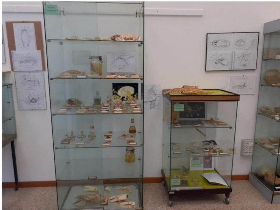
Crostacei Decapodi: Gamberi, Granchi, Aragoste ed Astici. Echinodermi, Briozoi