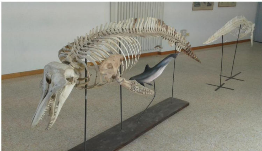
Mammiferi: 2 delfini. Alle pareti la storia della loro evoluzione.