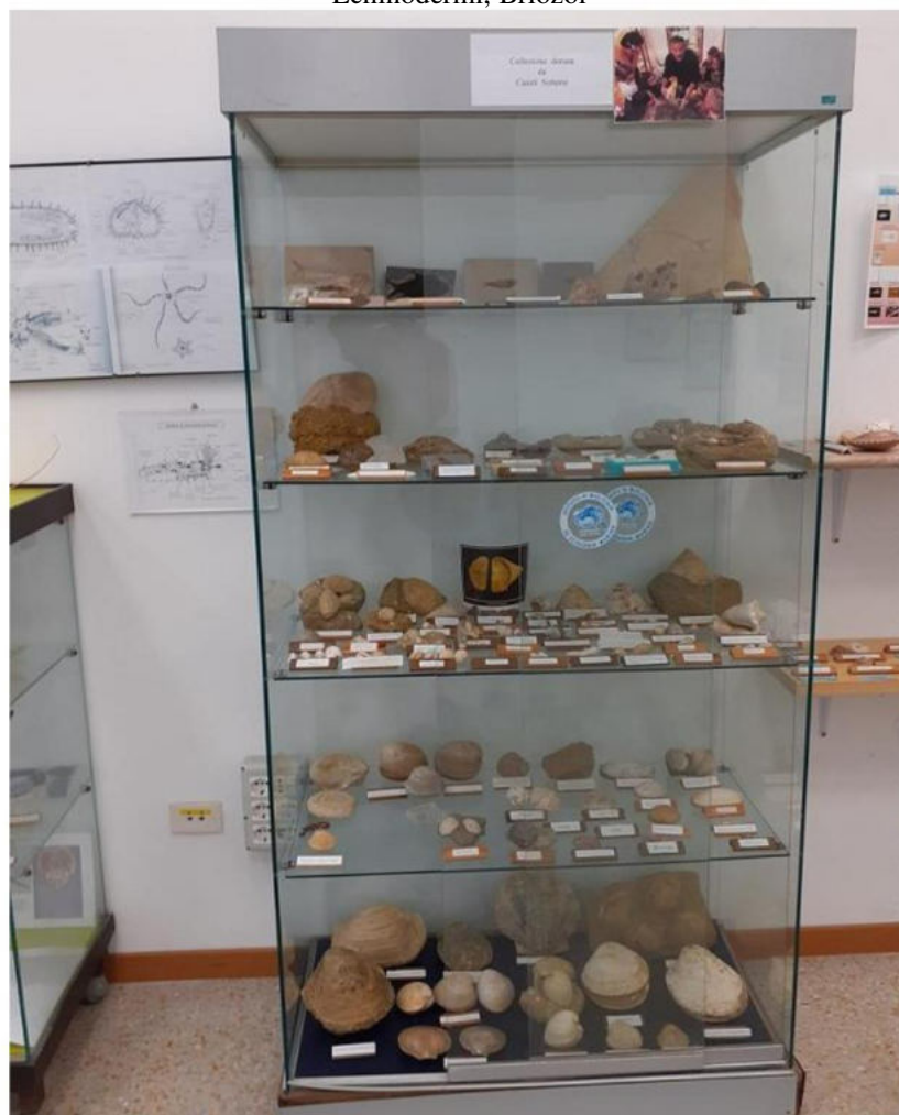
Fossili che mostrano i cambiamenti degli animali marini nel corso di decine di milioni di anni