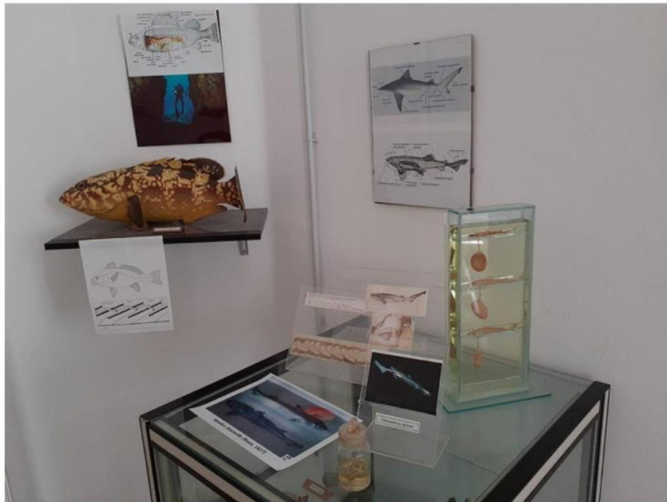
Pesci ossei e inizio pesci cartilaginei