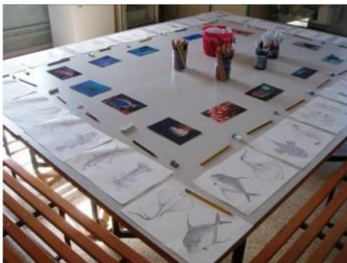
Figura 9: tavolo pronto per disegni e schede didattiche per i più piccoli.