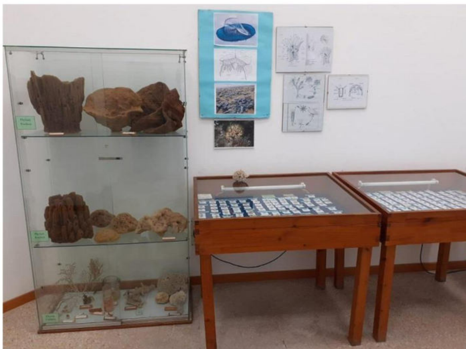
Poriferi e Cnidari