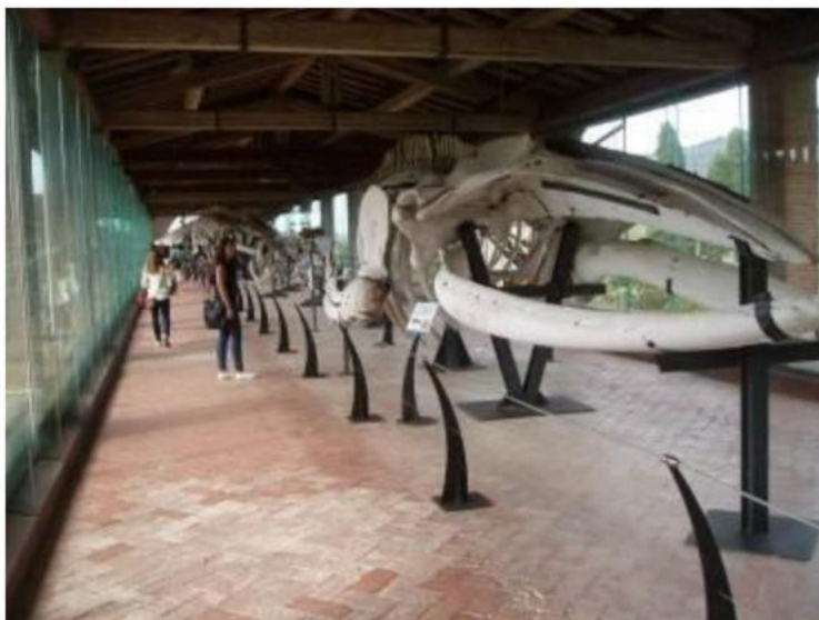
Figura 8: sala dei Mammiferi marini al Museo di Calci.