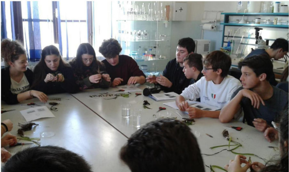
Figura 14 - studenti durante l'esercitazione sulla Posidonia oceanica

COSTO A STUDENTE base più scelta altra esercitazione: € 18,00 +IVA