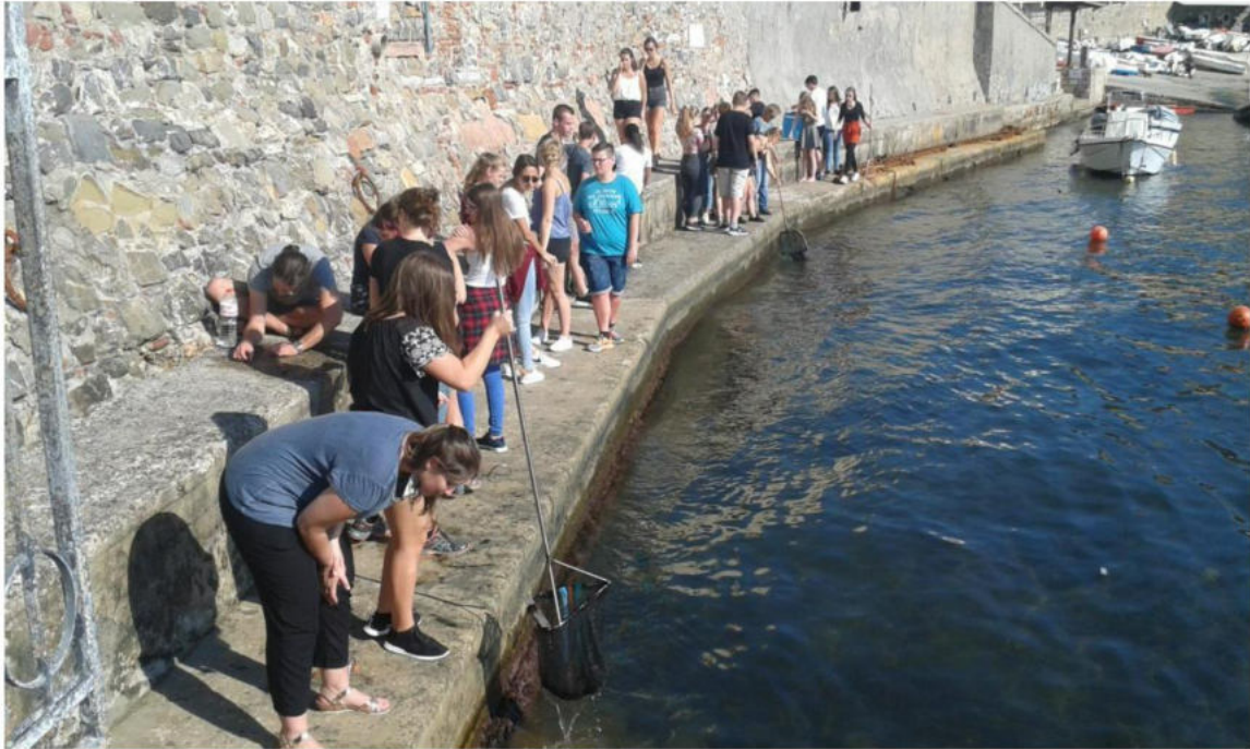
Figura 10: studenti durante il campionamento.