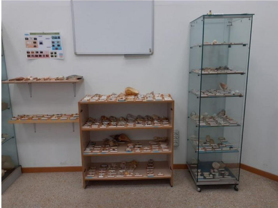
Molluschi tropicali che mostrano, con le stesse famiglie presenti in Mediterraneo, eventuali differenze