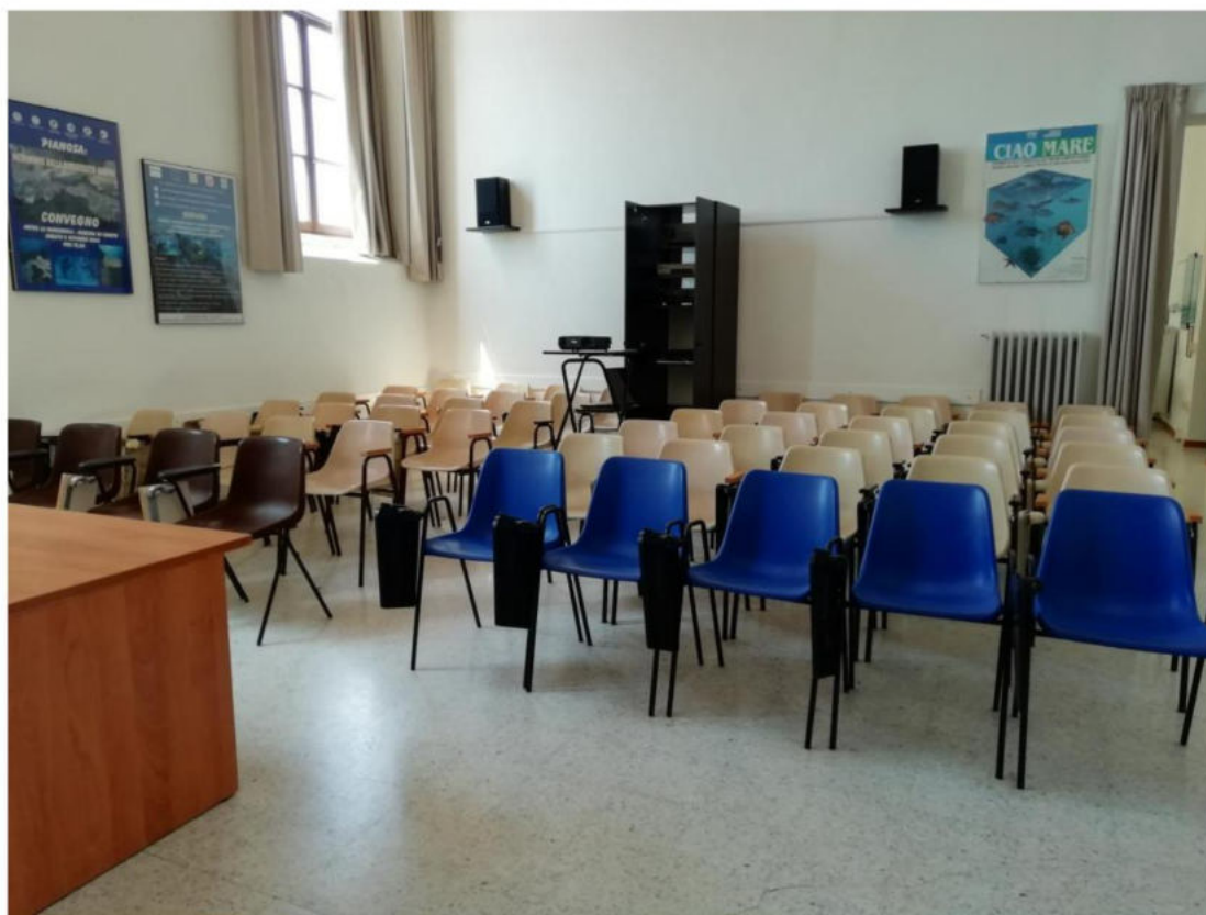
Figura 1: sala da proiezione.

N. B. Nella sala da proiezione, così come in tutti i laboratori e nel museo, è possibile mantenere le distanze tra gli studenti, come previsto dalle norme anti-COVID, sia per una classe che per due alternando le attività previste nell'arco della giornata.