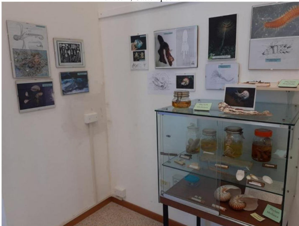
Molluschi, Cefalopodi e Anellidi