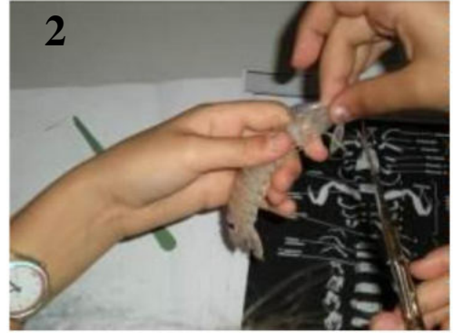
Figura 13: studenti durante l'esercitazione di anatomia e fisiologia di vertebrati (dissezione di un elasmobranco (1)) ed invertebrati marini (dissezione di un crostaceo Squilla mantis (2)).