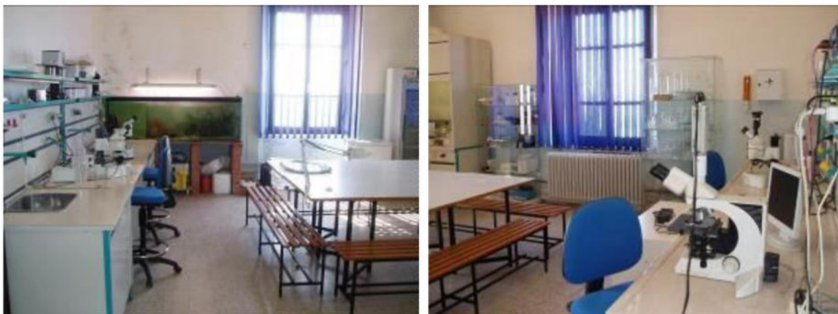
Figura 4: laboratorio per la ricerca scientifica ed esercitazioni di chimica.