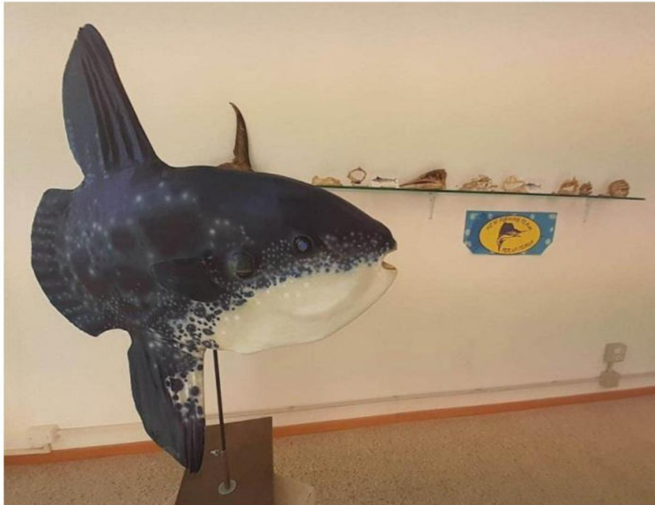
Pesci ossei e mascelle le cui dentature mostrano il regime alimentare